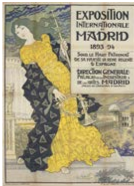
Exposition Internationale de Madrid, 1893. MNAC. Eugène Grasset