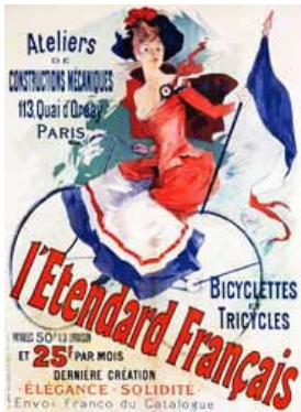
L'Etendard Français, Jules Chéret's (1891) poster for the bicycle shop on the Quai d'Orsay, Jules Chéret's