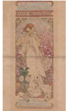
Dame aux camelias: Sarah Bernhardt, La Théâtre de la Renaissance, Paris,(1898) Alphons Mucha