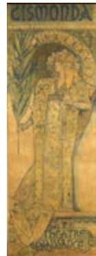
Gismonda, Theatre de la Renaissance, Interpret/s: Sarah Bernhardt (Actriu), Alphons Mucha