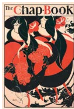
The Chap-Book (1894) William Bradley