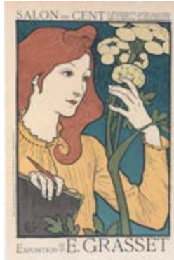
Exposition au Salon des Cent (1898) Eugène Grasset