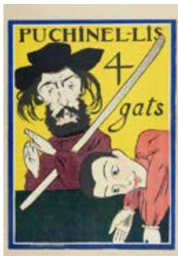
Putxinellis dels Quatre Gats (1899) Ramón Casas