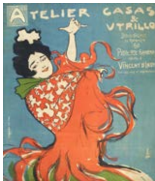
Atelier Casas & Utrillo (1898). Ramón Casas