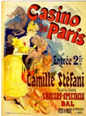
Casino de Paris, Camille Stéfani (1891) Jules Chéret's