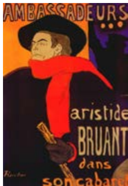
Ambassadeurs (1892). H. M. R. Toulouse-Lautrec