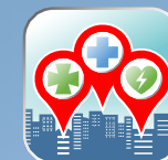
6. Icono 72 x 72 cm