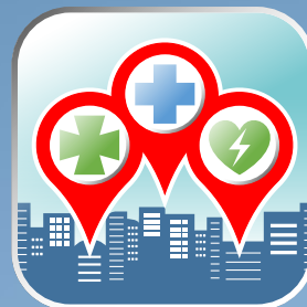
5. Icono 512 x 512 px