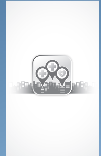
4. Anuncio escala grises 9 x 15 cm