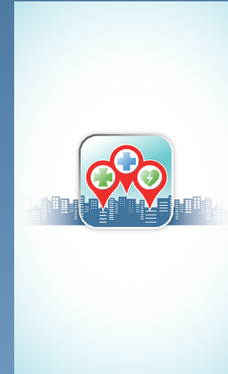
3. Anuncio CMYK 9 x 15 cm