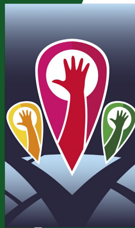
Anuncio CMYK 9x15 cm