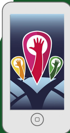
Smartphone 750x1334 píxels