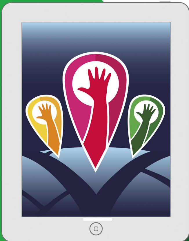
Original 1536x2048 píxels